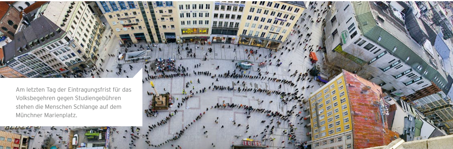
Am letzten Tag der Eintragsfrist für das Volksbegehren gegen Studiengebühren stehen die Menschen Schlange auf dem Münchner Marienplatz.